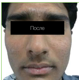
Результат после 5 сеансов