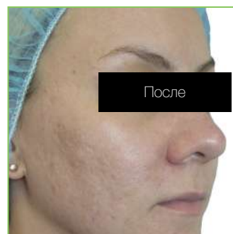
Результат после 2 сеансов