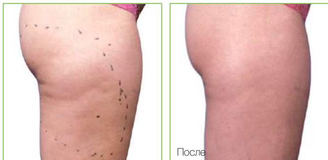
Результат после 7 сеансов