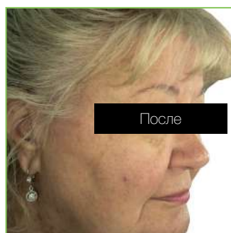
Результат после 1 сеанса