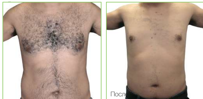
Результат после 2 сеансов