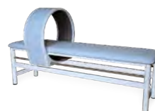
Магнитотерапевтическая кушетка с соленоидом 70 см