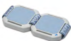
Аппликатор двойной диск