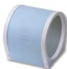
Соленоид 30 см